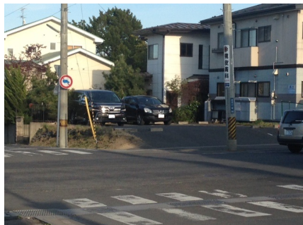
三浦駐車場配置図