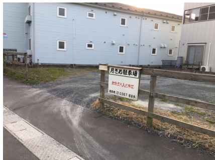
新丁駐車場 配置図