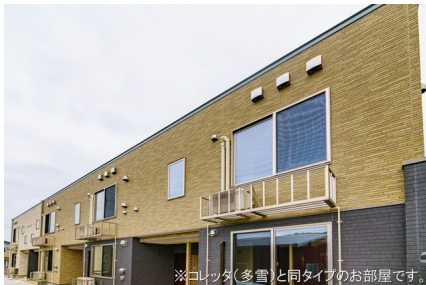
※コレクタ(多雪)と同タイプのお部屋です。