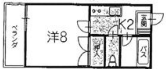
※グレー部分ロフト