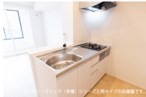
※キッチンラック (多量) シリウスと同タイプのお部屋です。