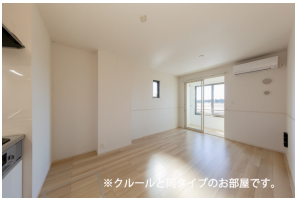
※クルールと同タイプのお部屋です。