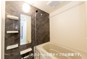
※クルールと同タイプのお部屋です。