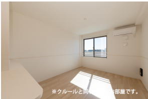
※クルールと同タイプのお部屋です。