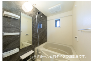
※クルールと同タイプのお部屋です。