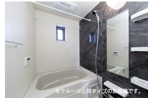
※クールと同タイプのお部屋です。