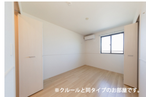
※クールと同タイプのお部屋です。