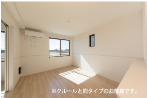
※クールと同タイプのお部屋です。