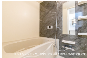
※バスシャワーシック (多額) シリコンは同タイプのお取組です。