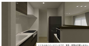
※こちらはイメージ画像です。実際・実物は写真と異なります。