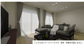
※こちらはイメージ画像です。実際・実物は写真と異なります。